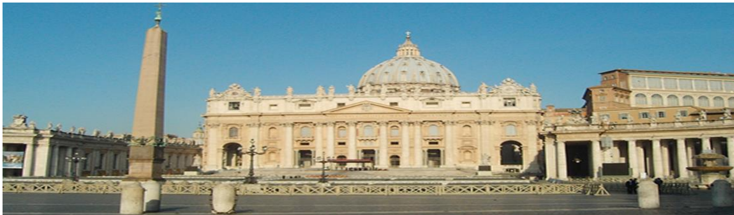
Basilica de San Pedro – Ciudad del Vaticano