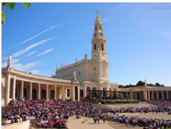
Basílica de Nuestra Señora del Rosario - Fátima

Desayuno , en el hotel. Por la mañana salida para realizar la visita panorámica de la bella ciudad de Lisboa, situada junto a la desembocadura del río Tajo. Recorreremos sus principales avenidas y monumentos como la Torre de Belem y el Monasterio de los Jerónimos. Almuerzo . y salida hacia la bella población de Obidos, con su ambiente medieval y continuación a Fátima, llegada a Cova de Iría uno de los mayores centros de Peregrinación de la Cristiandad. Tiempo libre para visitar el Santuario de Nuestra Señora del Rosario de Fátima, la Capilla de las Apariciones y su Basílica. Después de la cena podremos asistir a la Procesión de las Antorchas. Alojamiento en el hotel.