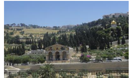
Monte de los Olivos – Jerusalén

Desayuno en el hotel. Por la mañana salida para realizar la visita al Monte de Los Olivos con la Iglesia de la Ascensión, Iglesia del Padre Nuestro, donde esta oración se encuentra escrita en mas de 100 idiomas. Desde el mirador tendremos una maravillosa vista de la Mezquita de Omar o Monte Moria; donde Abraham iba a sacrificar a su Isaac, lugar donde Salomón construyó el Primer Templo. Continuaremos hacia el Huerto de Getsemaní, donde hay 8 olivos, testigos del sudor de sangre de Cristo (Mt. XXVI, 36-46; Lc. XXII, 39-46). Visita de la Basílica de la Agonía o de Todas las Naciones. Después del almuerzo salida hacia Belén y realizaremos la visita de la Gruta de la Natividad, (Lc. II, 1-20). Celebración de la Santa Misa en Belén. Regreso al hotel, cena y alojamiento.