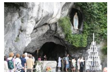
Gruta de las Apariciones

Desayuno y salida por carretera hacia Lourdes. Almuerzo en ruta. Llegada a última hora de la tarde y después de la cena podremos dirigirnos al Santuario para participar en la Procesión de las Antorchas. Alojamiento.